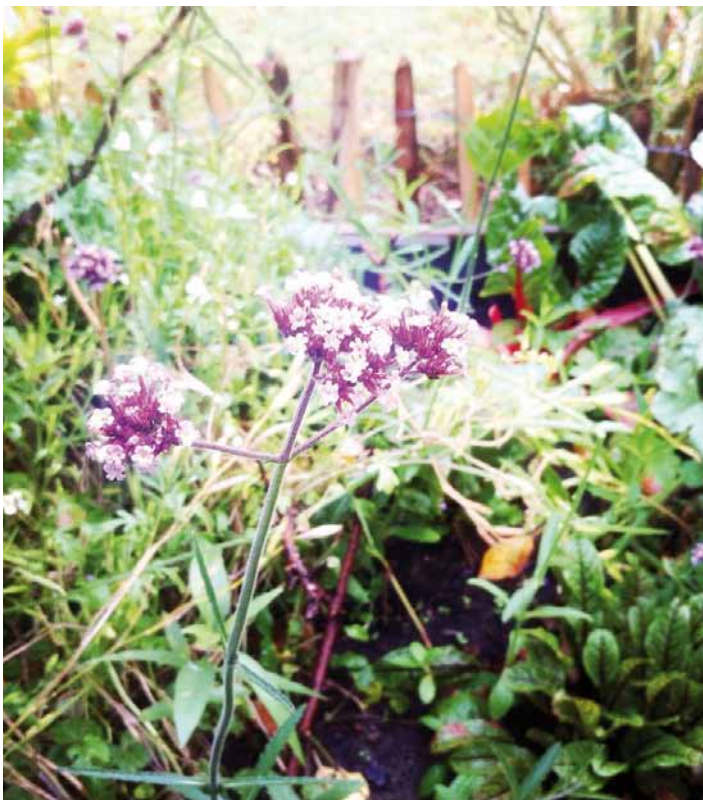
Viele Menschen wünschen sich naturnahe Kleingärten zur Erholung und zum Anbau von Obst und Gemüse.

Gemeinsame Überzeugung aller war, dass dieses Konzept eine stimmige und soziale Antwort auf den „Flächenfraß“ durch einen alles beherrschenden Konzern darstellt und unbedingt zur Grundlage eines bezirklichen Bebauungsplans gemacht werden soll, an dem die Bezirkspolitik und das Bezirksamt Eimsbüttel nicht vorbeikommen – und zwar nicht „irgendwann“ (Bezirksamtsleiter Gätgens), sondern noch vor den Wahlen zur Bezirksversammlung im Mai 2019!